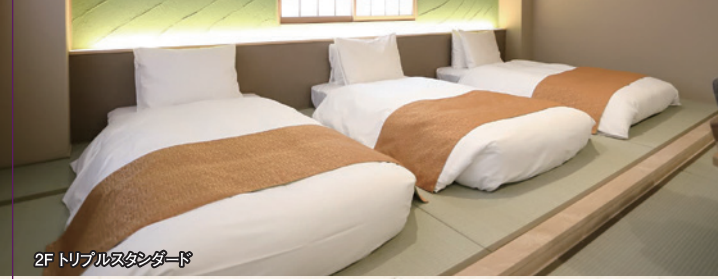
2F トリプルスタンダード