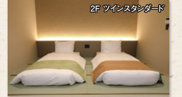
2F ツインスタンダード