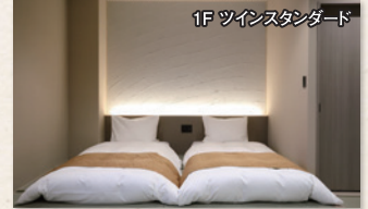
1F ツインスタンダード