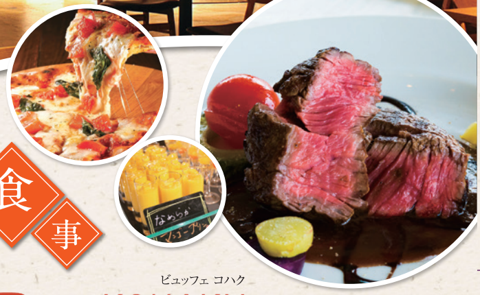
ビュッフェ コハク