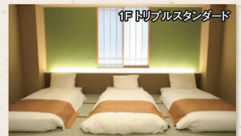
1F トリプルスタンダード