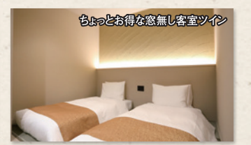
ちょっとお得な窓無し客室ツイン