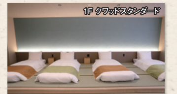
1F クワッドスタンダード