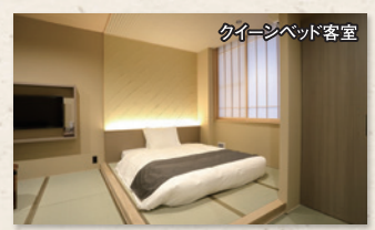
クイーンベッド客室