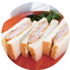
エビカツサンド 750円

旨味たっぷりアブリの 天然エビ100%のエビカツと タルタルソースの 相性がばっちりです。