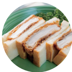
もなかカツサンド 650円